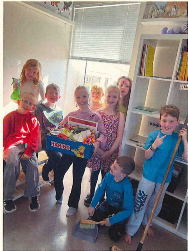
De stolte vindere 0-1 klasse. Herfra stort tillykke